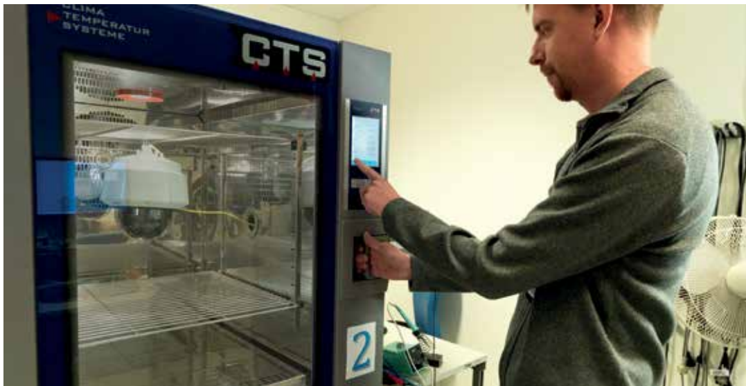
Рис. 5. Температурные испытания в климатической камере.

Лабораторные испытания проводятся в климатических камерах, где можно симитировать любую температуру и погодные условия. Испытания проводятся с запасом 15 °C от верхней и нижней границы диапазона рабочих температур. Влажность при этом составляет от 0 до 100%.