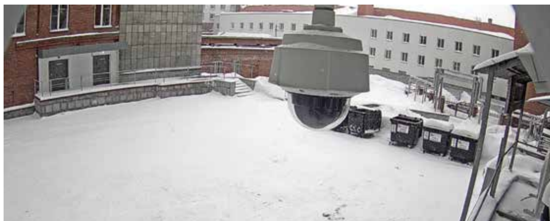
Рис. 6. Камера Axis на площадке в Новосибирске.