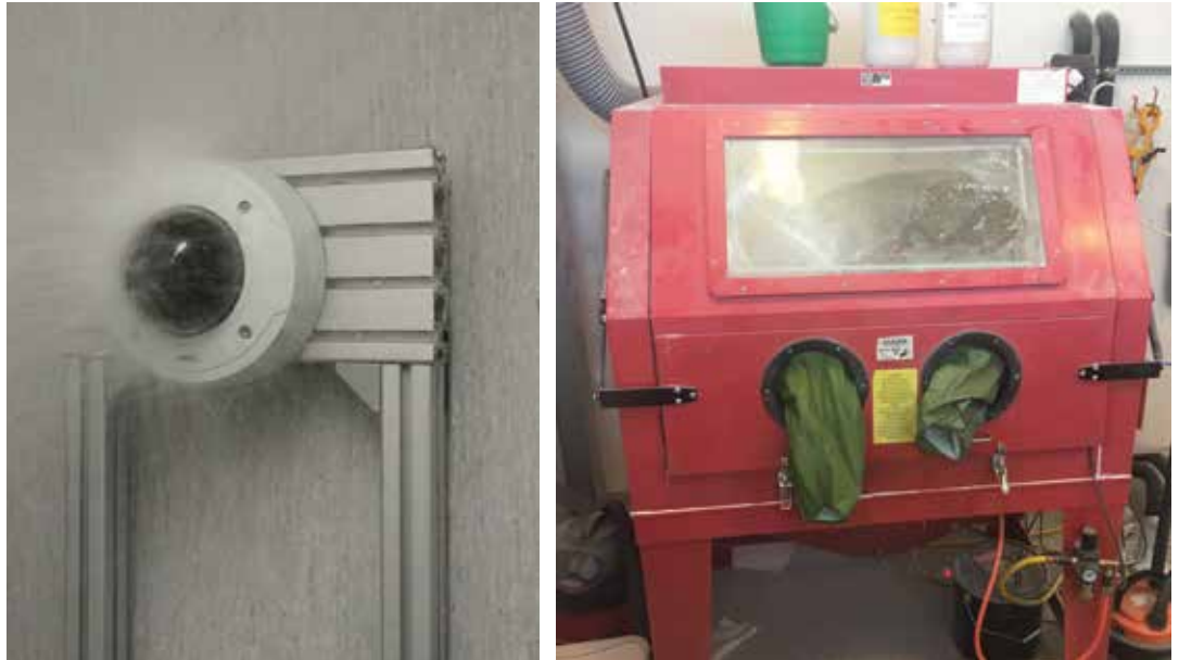
Рис. 3. Слева: испытание камеры на водонепроницаемость; справа: пылевая камера.

На следующем этапе камера подвергается воздействию воды под высоким давлением со скоростью потока 100 л/мин с расстояния 2,5–3 м. После испытания камеру открывают и проверяют на наличие воды, уделяя особое внимание уплотнительным прокладкам. Кроме того, тщательно проверяется функциональное состояние устройства.