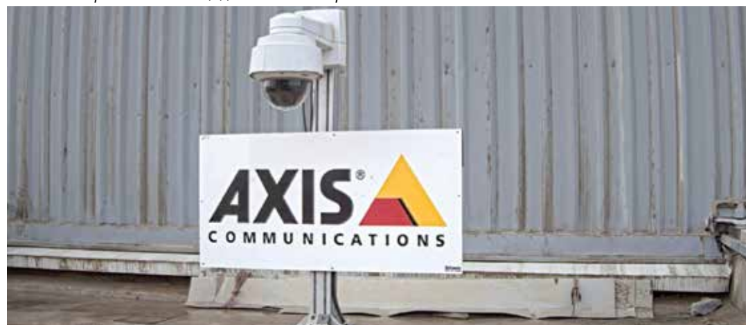
Рис. 7. Камера Axis на площадке в Дубае.