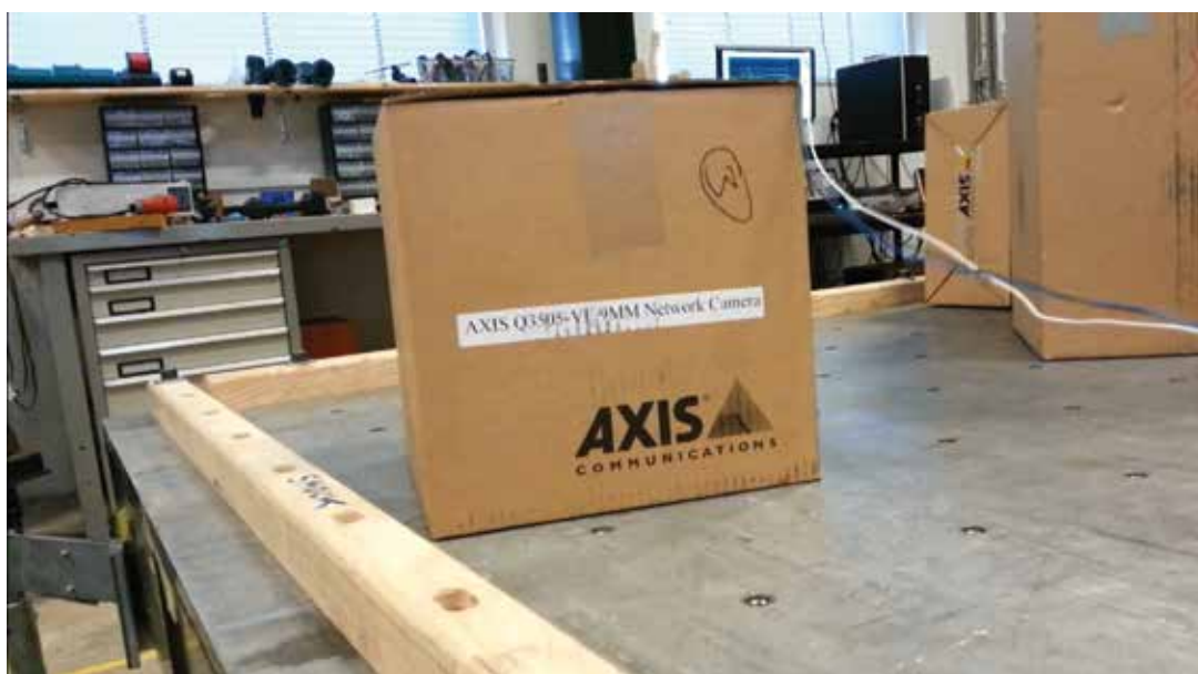
Рис. 4. Оборудование, используемое для испытаний, имитирующих транспортировку.

Чтобы проверить целостность упаковки и ее способность защитить устройства, во время испытаний камера остается в упаковке. Камера в упаковке кладется на платформу. Затем она подвергается воздействию случайной комбинации вибраций, действующих на грузовик на неровной дороге. Типовое испытание имитирует тысячи километров транспортировки по земле и по воздуху.