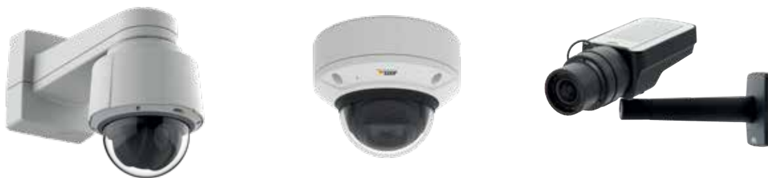
Рис. 1. Виды сетевых камер Axis.

В данном документе собрана информация о всесторонних комплексных испытаниях, проводимых с целью проверки качества продукции Axis.