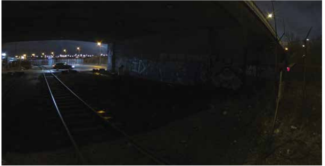
图 10: 这是人在现场所能看到的场景。图像经过处理, 呈现了人眼在视觉上所感受到的黑暗。

图 11 是来自相同场景的另一张照片, 使用时下的智能手机拍摄。当然, 智能手机本身无法优化图像以供监控之用, 但桥下区域呈现出来的是一片漆黑, 这也进一步说明了真实场景有多暗。