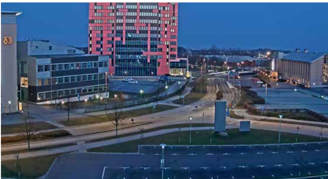
图 2：“觅光者”摄像机通过优化利用现有光线抓拍的夜间视频。

“觅光者”摄像机可以加装红外照明器，转而使用摄像机的夜间模式。夜间模式的红外灰度图像在（比如）视频分析应用中极为有用，但在很多使用场合中，白天模式视频因其色彩和自然的观感，无疑更具吸引力。