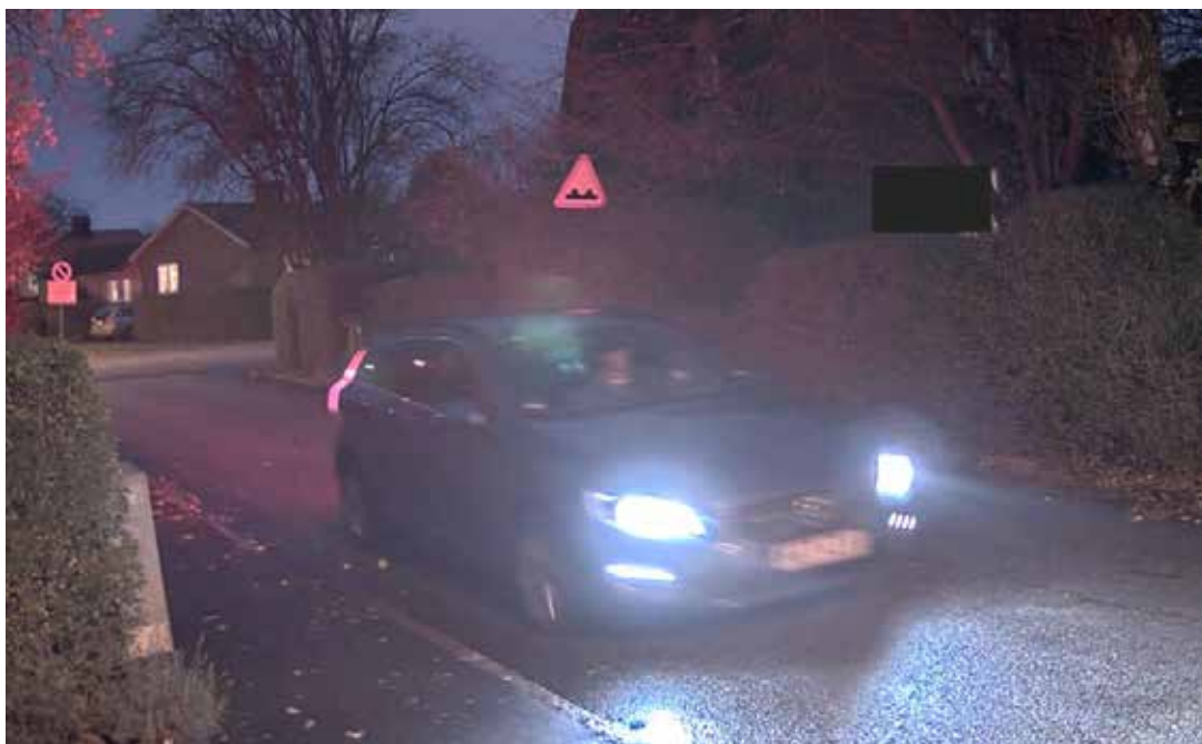
图 8: 长曝光时间可能导致明显的运动模糊。在此视频抓拍中，如果缩短所使用的曝光时间，车牌可能更易于辨认。

在低光场景中，传感器通常需要较长的曝光时间，才能捕捉到足够多的光子以生成可用的图像。如果曝光时间过短，图像变得过暗，可以通过数字方式提亮，但这同时也伴有噪声的增大。然而，如果曝光时间较长，图像中呈现的一切快速运动的物体都可能变得模糊，因为在曝光间隔期间，这些物体与传感器之间产生了相对运动。这种现象被称为“运动模糊”。在光线有限的场景中，这种问题很常见。