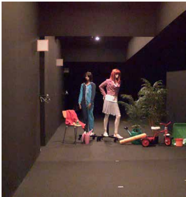
图 5: 物体上测得的照度为 0.2 lux - 0.7 lux。“觅光者”摄像机提供明亮的色彩。人眼的色彩视觉敏锐度并不高, 基本上只能辨认较亮表面, 能看清的细节非常少。

图 5 至图 7 显示了在照度逐渐降低时使用与先前相同的设备拍摄的同场景的裁剪图像。在大约 0.5 lux (图 5) 时, 人眼丧失色彩视觉, 而“觅光者”摄像机依然呈现明亮的彩色图像。事实上, 直到低至 0.02-0.08 lux (图 7) 的测试照度, “觅光者”摄像机也能够保持色彩视觉, 虽然这一性能会显著减弱。在这些照度下, 人眼既无法辨别色彩, 也无法辨别细节, 整个场景几乎一片漆黑, 只有色彩最亮的物体隐约可辨。