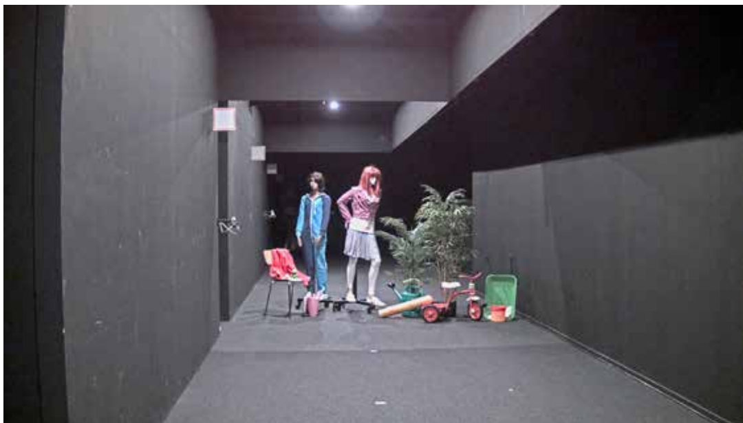
图 4: 光线强度介于 1.5 lux (三轮车上) 至 5 lux (假人腰部处) 之间的工作室场景。“觅光者”摄像机提供了清晰的色彩呈现以及不可思议的明亮图像, 而相比之下, 人眼可能依然能够辨识色彩, 但看到的场景却是非常暗的。

图 5 至图 7 显示了在照度逐渐降低时使用与先前相同的设备拍摄的同场景的裁剪图像。在大约 0.5 lux (图 5) 时, 人眼丧失色彩视觉, 而“觅光者”摄像机依然呈现明亮的彩色图像。事实上, 直到低至 0.02-0.08 lux (图 7) 的测试照度, “觅光者”摄像机也能够保持色彩视觉, 虽然这一性能会显著减弱。在这些照度下, 人眼既无法辨别色彩, 也无法辨别细节, 整个场景几乎一片漆黑, 只有色彩最亮的物体隐约可辨。