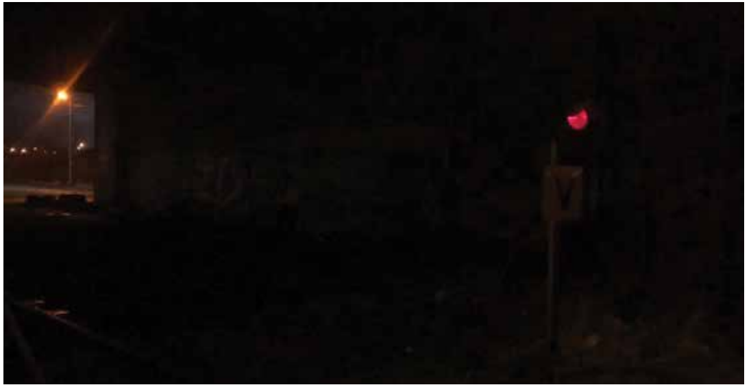
图 11: 使用 iPhone8 智能手机拍摄的相同场景

图 11 是来自相同场景的另一张照片, 使用时下的智能手机拍摄。当然, 智能手机本身无法优化图像以供监控之用, 但桥下区域呈现出来的是一片漆黑, 这也进一步说明了真实场景有多暗。