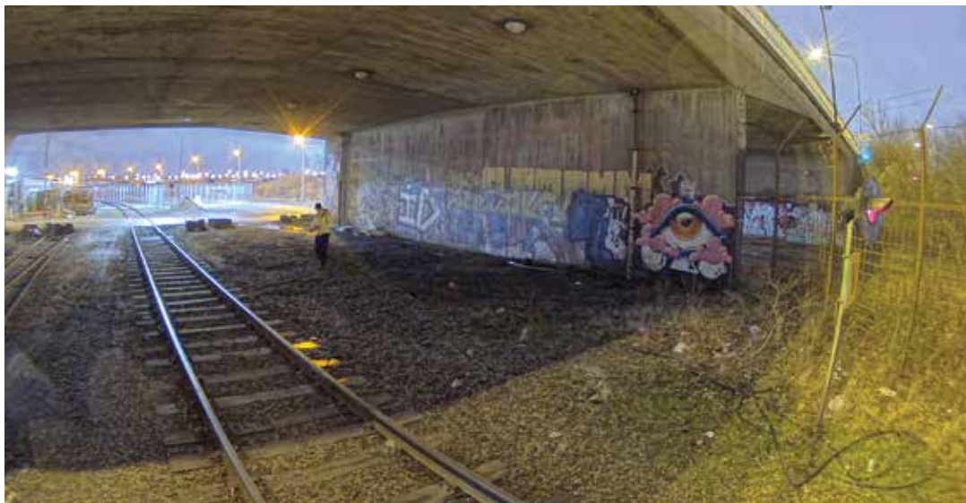
图 9: Lightfinder 2.0 摄像机呈现的清晰明亮的彩色图像，尽管桥下的光线强度仅为 0.05 lux。

图 9 是来自搭载 Lightfinder 2.0 的安讯士摄像机的监控视频测试的抓拍。图像看似没有任何特别之处 – 但如果你知道真实场景有多暗，就不会这么认为。在图像中，可以看到站在桥下的人，其身边的光线强度经测量只有 0.05 lux。Lightfinder 2.0 重现了这个非常暗的部分，效果可媲美白天拍摄的场景。