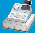
Кассовые терминалы и кассовые серверы

Статистические данные на данный момент и за прошедшие периоды легко доступны из любого места в любое время.