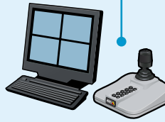
Видеонаблюдение и видеозапись в помещении магазина