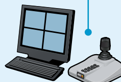
Controllo e registrazione dei movimenti all'interno del punto vendita