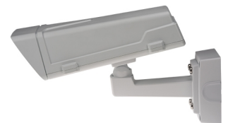
AXIS T94R01P 전선관 백 박스 포함

AXIS T93F 시리즈는 벽면 마운트 및 선캡이 제공됩니다. AXIS T94R01P 전선관 백 박스 및 AXIS Corridor Format 브래킷은 옵션 액세서리로 사용하여 설치 유연성을 높일 수 있습니다.