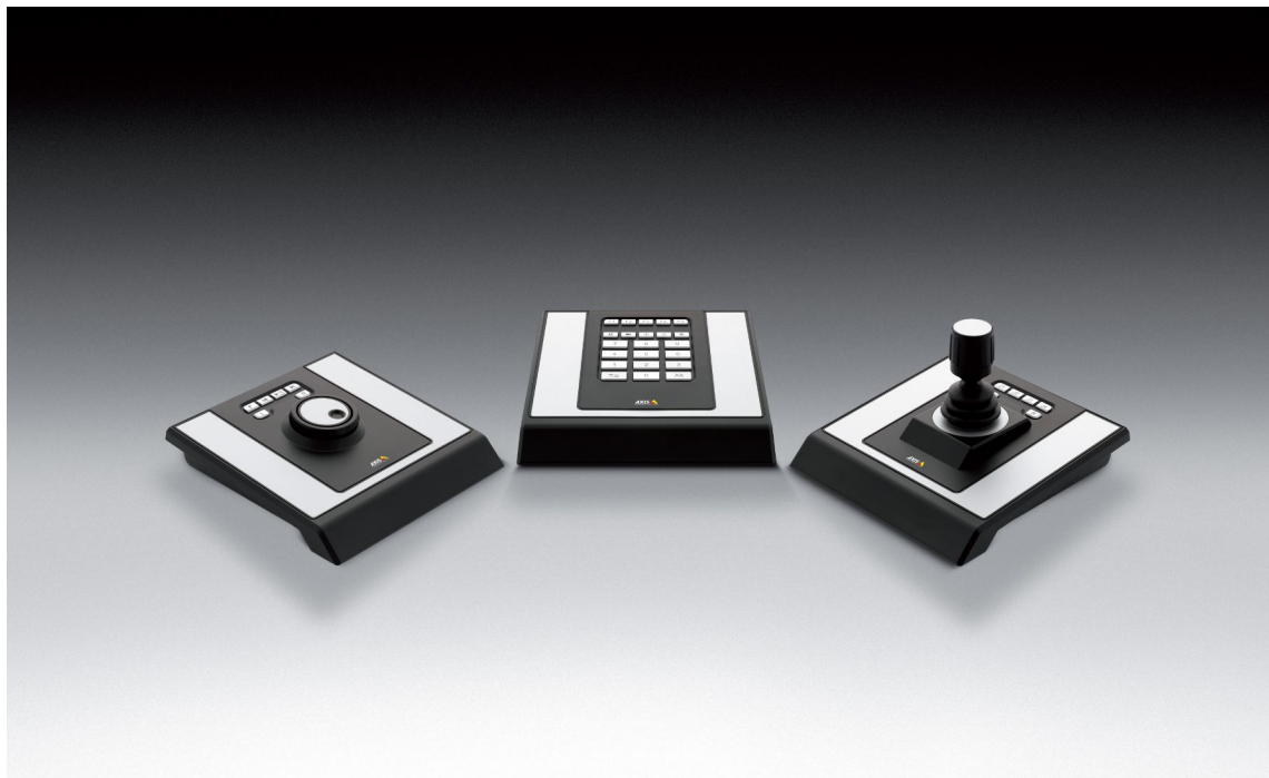
Tableau de contrôle modulaire pour la gestion des vidéos et caméras professionnelles