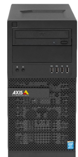
Das AXIS S9001 Desktop Terminal ist separat erhältlich.