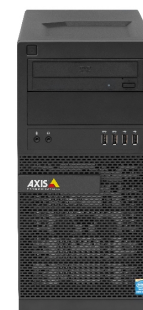
Terminal desktop AXIS S9001 vendido separadamente