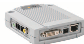
Solution de supervision des produits Axis.

Dans les situations où seul l'affichage vidéo en direct est nécessaire, tel qu'un moniteur de visionnage public à l'entrée d'un magasin, AXIS P7701 offre une solution plus avantageuse que de connecter un écran au réseau par le biais d'un PC. AXIS P7701 peut également compléter un système de gestion vidéo en aidant à décharger le serveur principal du décodage des flux numériques à des fins d'affichage uniquement.