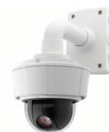
注: 取り付けアクセサリは別売

また、カメラに内蔵したSD/SDHCカードスロットによるエッジストレージへの書き込みをサポートしています。