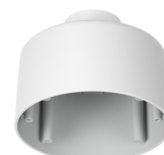
PC30VE-VB Kit de montaje colgante