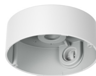
CB30VE-VB Caja para conductos