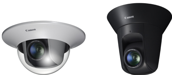
С куполом DR41-C-VB для внутренних помещений

1,3-мегапиксельная поворотная сетевая камера видеонаблюдения VB-M42 совмещает мощный 240x зум, превосходные рабочие характеристики в условиях слабого освещения и быструю автофокусировку. Различные возможности для установки внутри и вне помещений.