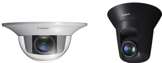
Mit klarem Domgehäuse DR41-C-VB für den Innenbereich

Die VB-H43 Full-HD PTZ IP-Sicherheitskamera vereint überragenden 240fach Zoom mit erstklassigen Low-Light-Eigenschaften und schnellem Autofokus. Sie bietet flexible Installationsmöglichkeiten für den Innen- und Außeneinsatz.