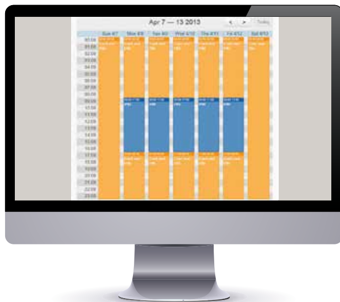
Récapitulatif clair des plannings d'accès en fonction du rôle des utilisateurs dans l'entreprise, ainsi que des calendriers de vacances et des week-ends.