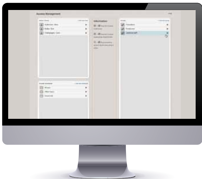
Fonction d'importation rapide des détenteurs de carte existants par simple glisser-déplacer et partage automatique des configurations pour les contrôleurs d'accès ajoutés.

Les solutions IP intelligentes permettent d'éviter la centralisation pour gagner en simplicité d'installation et en évolutivité. Le logiciel de gestion AXIS Entry Manager évite de recourir à un centre de commande ou un serveur central. Chaque commande de porte réseau AXIS A1001 dispose d'une mémoire et d'un processeur intégrés. Les données système, les identifiants et les configurations redondantes sont automatiquement synchronisées sur l'ensemble des modules composant le système.