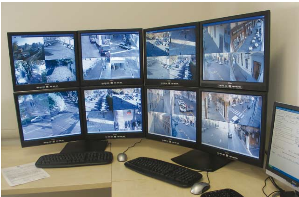
Axis nätverkskameror ger video av hög kvalitet och en tydlig överblick över områden oberoende av geografiskt läge. Med hjälp av ett bra datorgränssnitt underlättas övervakningen i kontrollrummet.

Riskbedömningen omfattar att identifiera, mäta och kartlägga källan till risker. De väsentliga risker som