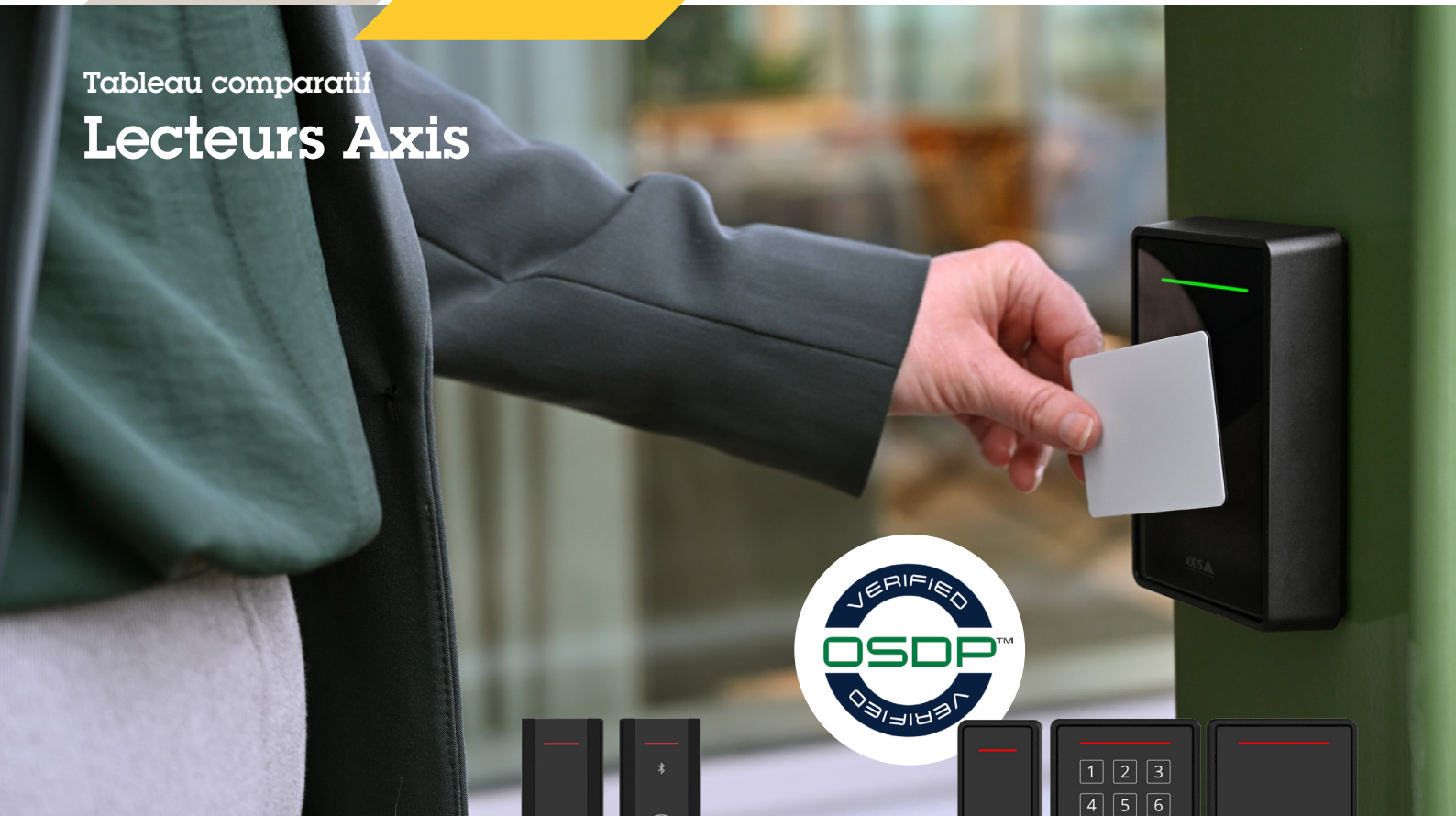
Tableau comparatif Lecteurs Axis