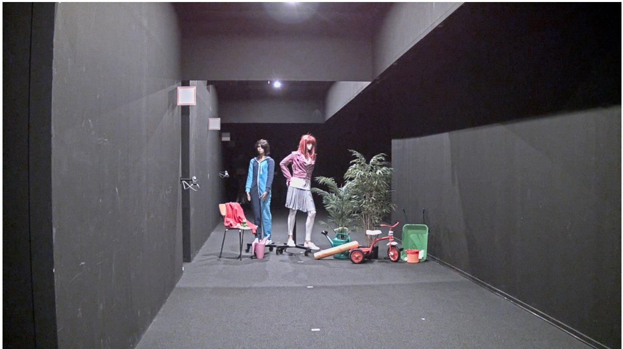
Figure 4. Cena de estúdio com intensidade de luz entre 1,5 lux (no triciclo) e 5 lux (na altura da cintura dos manequins). A câmera com Lightfinder entregou cores claras e uma imagem surpreendentemente brilhante. O olho humano também poderia discernir as cores, mas percebeu que a cena estava muito escura.

escura do que sugerido pela imagem, mesmo depois que teve tempo suficiente para se adaptar. O olho ainda pode discernir cores, mas os níveis de luz podem ser descritos como "desconfortavelmente baixos".