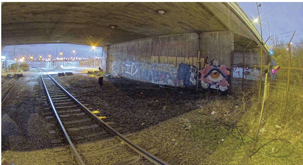
Figure 9. Uma imagem nítida, clara e colorida fornecida por uma câmera com Lightfinder 2.0, embora a intensidade da luz fosse de apenas 0,05 lux sob a ponte.

A imagem a seguir é um instantâneo de um teste de videomonitoramento com uma câmera Axis com Lightfinder 2.0. Parece não haver nada de extraordinário em relação à imagem. Isso se você não sabe o quão escura a cena realmente era. A pessoa que pode ser vista na imagem, de pé sob a ponte, media a intensidade da luz, que chegava a apenas 0,05 lux. A tecnologia Lightfinder 2.0 reproduz esse local muito escuro como se estivesse repleto de luz do dia.