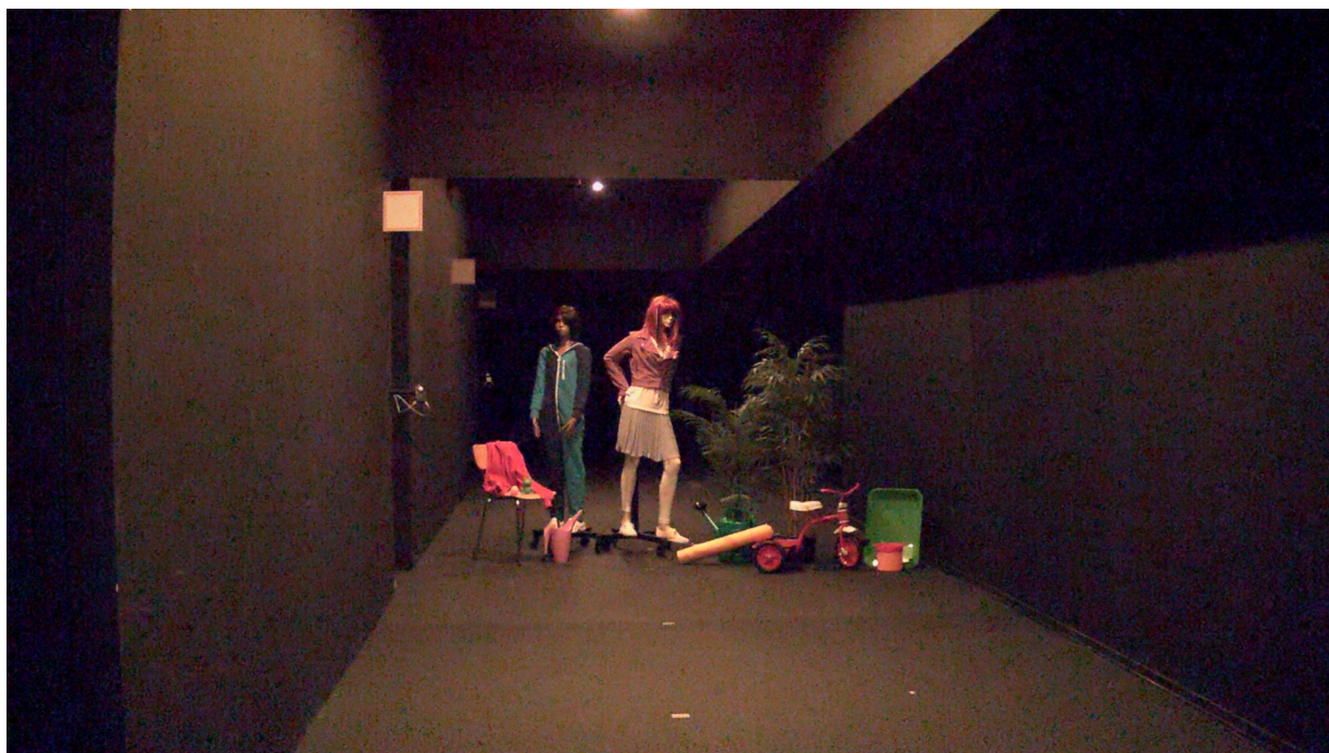
Figure 6. 0,1 lux - 0,3 lux medidos nos objetos. A câmera com Lightfinder fornece uma imagem colorida menos nítida, mas ainda muito detalhada. O olho humano não conseguia discernir as superfícies mais escuras e não identificava detalhes ou cores.