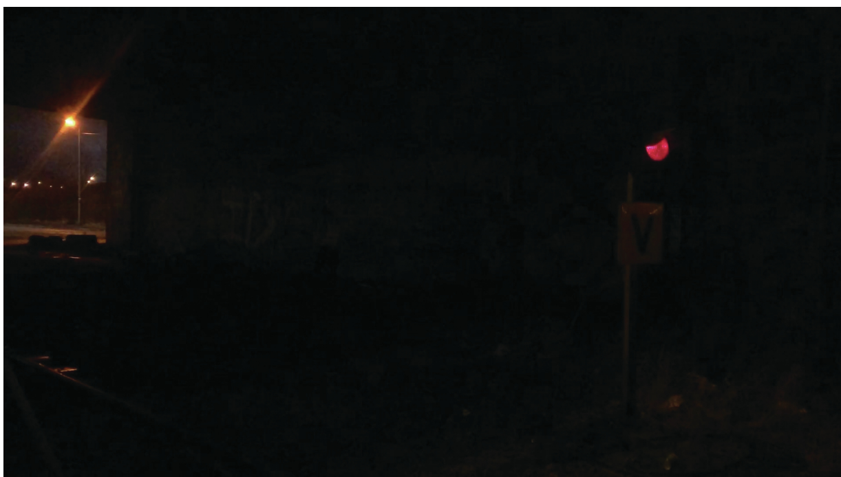
Figure 11. A mesma cena, mas capturada em um iPhone 8.

A próxima imagem é da mesma cena, porém capturada em um smartphone contemporâneo. Naturalmente, os smartphones não otimizam as imagens para fins de monitoramento, mas o fato da área sob a ponte ter ficado completamente escura dá uma ideia geral de quão escura a cena realmente era.