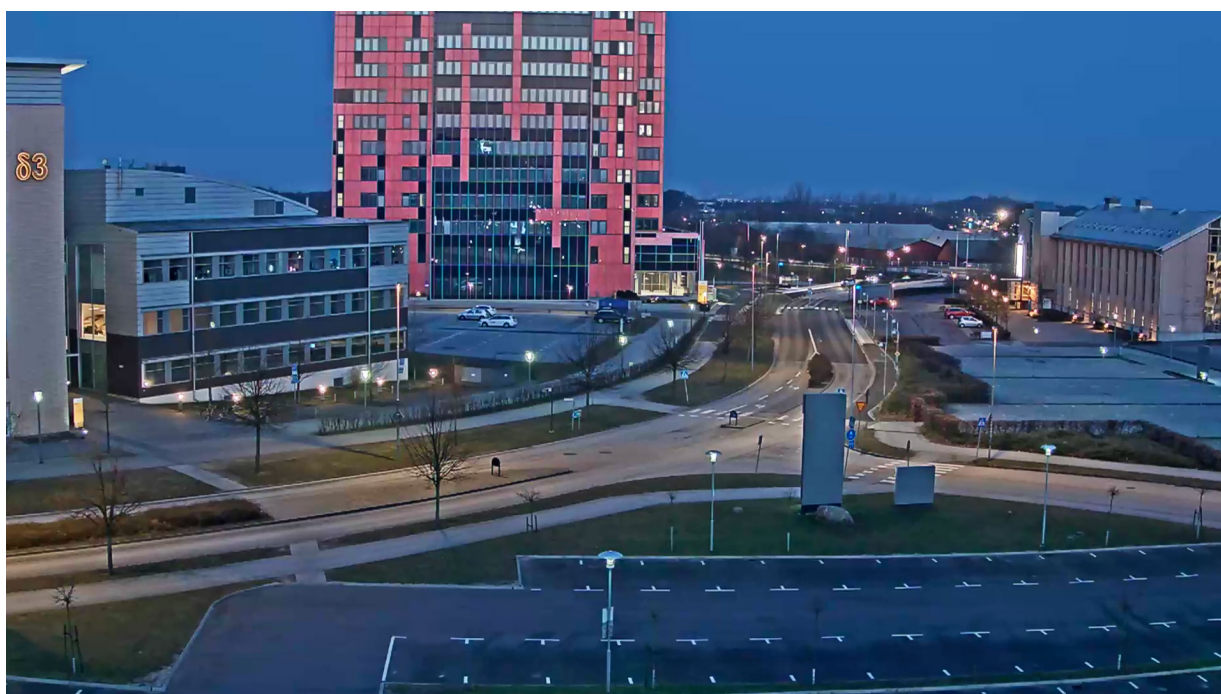
Figure 2. Instantâneo de um vídeo em modo noturno no qual uma câmera com Lightfinder otimiza o uso da luz existente.

exemplo, em aplicativos de análise de vídeo, mas em muitos casos de uso, o vídeo em modo diurno com suas cores e aparência natural é, sem dúvida, mais atraente.