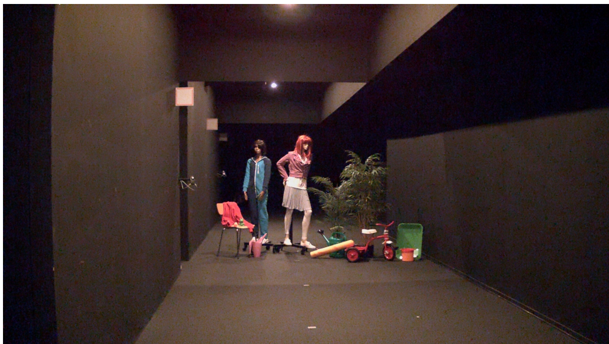
Figure 5. 0,2 lux - 0,7 lux medidos nos objetos. A câmera com Lightfinder fornece cores brilhantes. Para o olho humano, a visão em cores era questionável e as principais superfícies claras podiam ser discernidas, com muito poucos detalhes.

testados de 0,02 a 0,08 lux. Nesses níveis, o olho humano não consegue detectar cores e detalhes, e a cena parece quase completamente escura, com apenas os objetos mais claros levemente discerníveis.