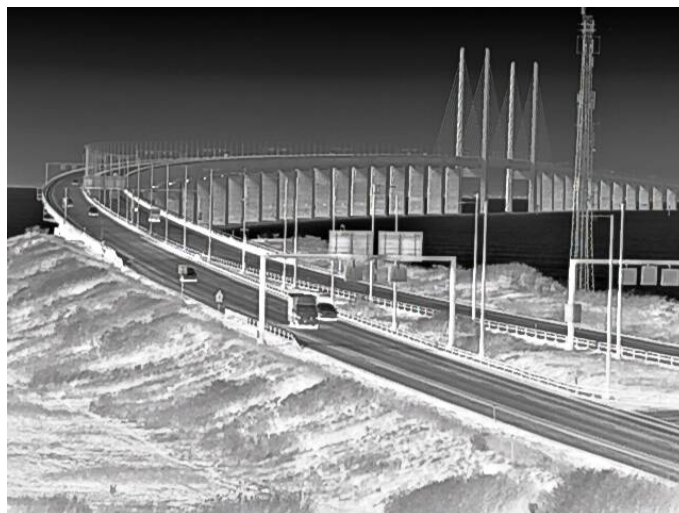
Contraste marqué de l'arrière-plan par une journée ensoleillée.

Par une journée nuageuse, le contraste de l'arrière-plan est de même moins prononcé, alors qu'il est plus net par une journée ensoleillée. Les écarts de température augmentent car les objets dont le matériau de surface est différent chauffent à des vitesses différentes.