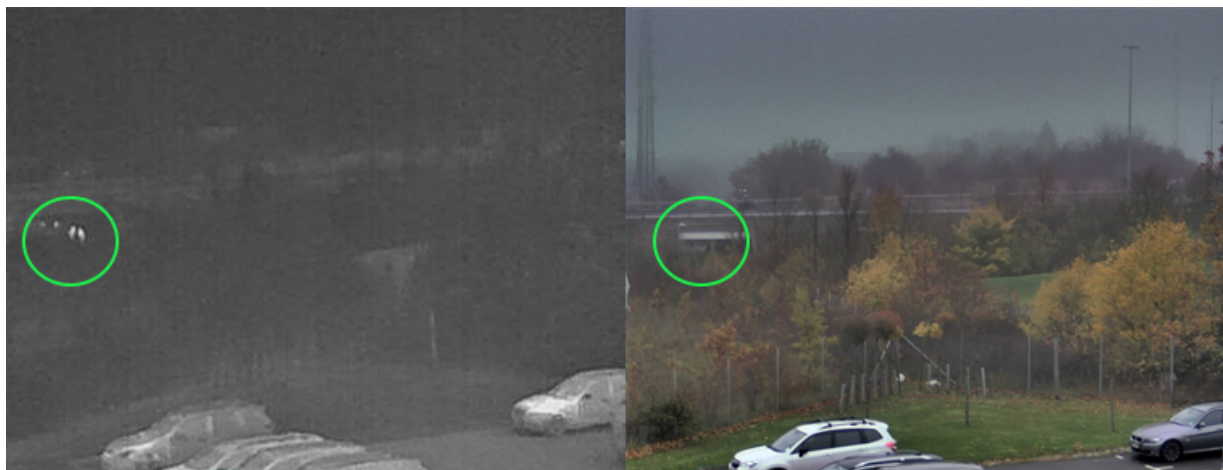
Images capturées par une caméra thermique (à gauche) et une caméra visuelle (à droite) par une journée pluvieuse. Les personnes (repérées par un cercle) sont facilement détectables avec la caméra thermique.

Bien que la diffusion réduise la quantité d'énergie qui atteint le capteur de la caméra, la température uniformisée de l'arrière-plan n'a pas d'influence sur le capteur. En revanche, comme le contraste de l'image est moins prononcé, il est plus délicat de distinguer des détails dans l'arrière-plan et l'image paraît plus uniforme. Il reste néanmoins plus facile de détecter une personne avec une caméra thermique, car le contraste entre la personne plus chaude et l'arrière-plan plus froid est plus net.