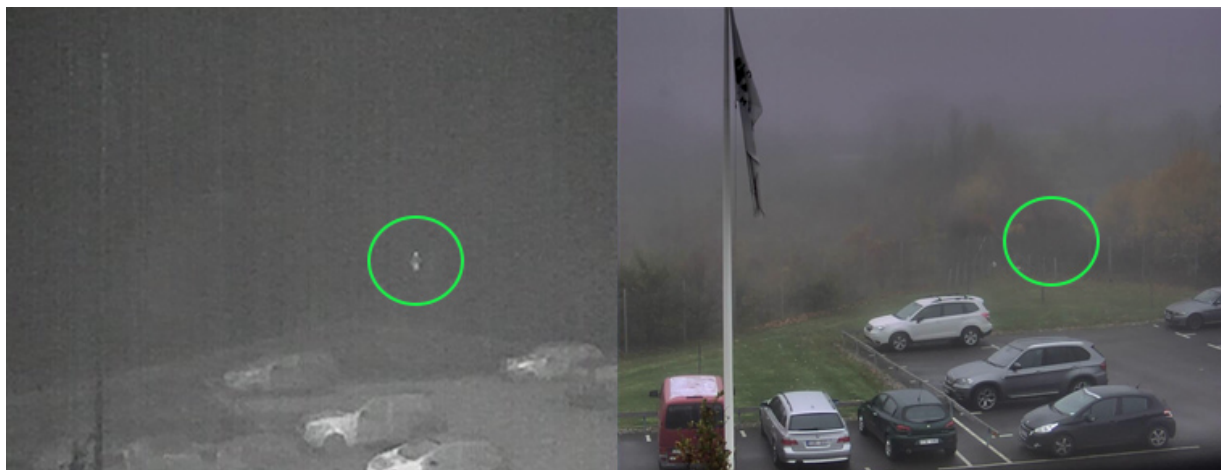
Images capturées par une caméra thermique (à gauche) et une caméra visuelle (à droite) par une journée brumeuse. Il est possible de distinguer une personne (repérée par un cercle) avec la caméra thermique, mais pas avec la caméra visuelle.

Les caméras thermiques Axis fonctionnent principalement dans la bande infrarouge à grandes longueurs d'onde (LWIR). En général, la transmission des grandes longueurs d'onde est bien meilleure dans les atmosphères contenant des particules en suspension, comme la fumée et le brouillard, par rapport aux longueurs d'onde du spectre visible. Dans la plupart des cas, les longueurs d'onde visibles « courtes » sont absorbées et diffusées par les particules dans une plus large mesure que les longueurs d'onde LWIR. Cette propriété diminue la portée de détection des caméras visuelles par rapport aux caméras thermiques. Une personne clairement visible avec une caméra thermique dans le brouillard peut rester invisible pour une caméra visuelle.