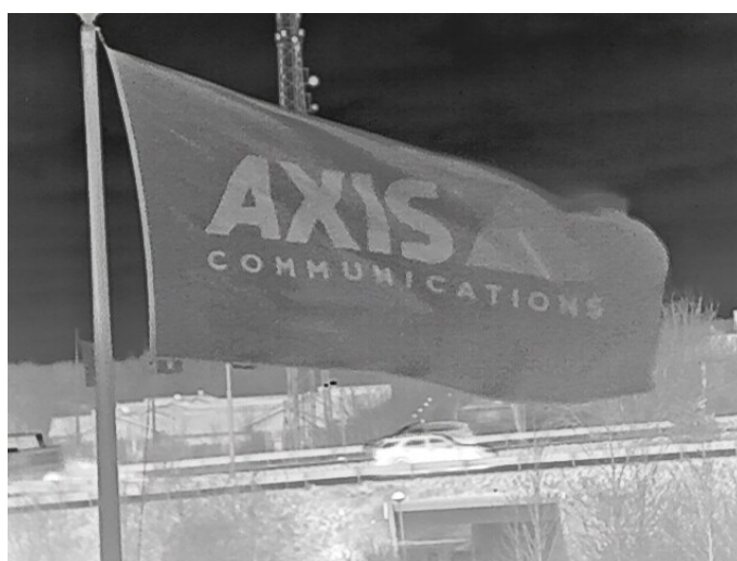
Drapeau perturbant la vue.

Les caméras thermiques qui prennent en charge la stabilisation électronique d'image sont moins sensibles aux vibrations. Néanmoins, la prise en compte de ces facteurs reste de mise pour l'installation d'une caméra thermique afin d'en optimiser les performances.