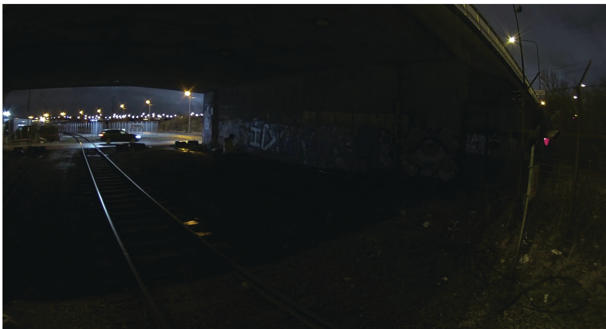
Figure 10. Esto es lo que podían ver las personas en la escena. La imagen se ha manipulado para emular la oscuridad experimentada por el ojo humano.

la cámara con Lightfinder 2.0, la zona debajo del puente era muy oscura, aunque todavía era posible distinguir algunos detalles.