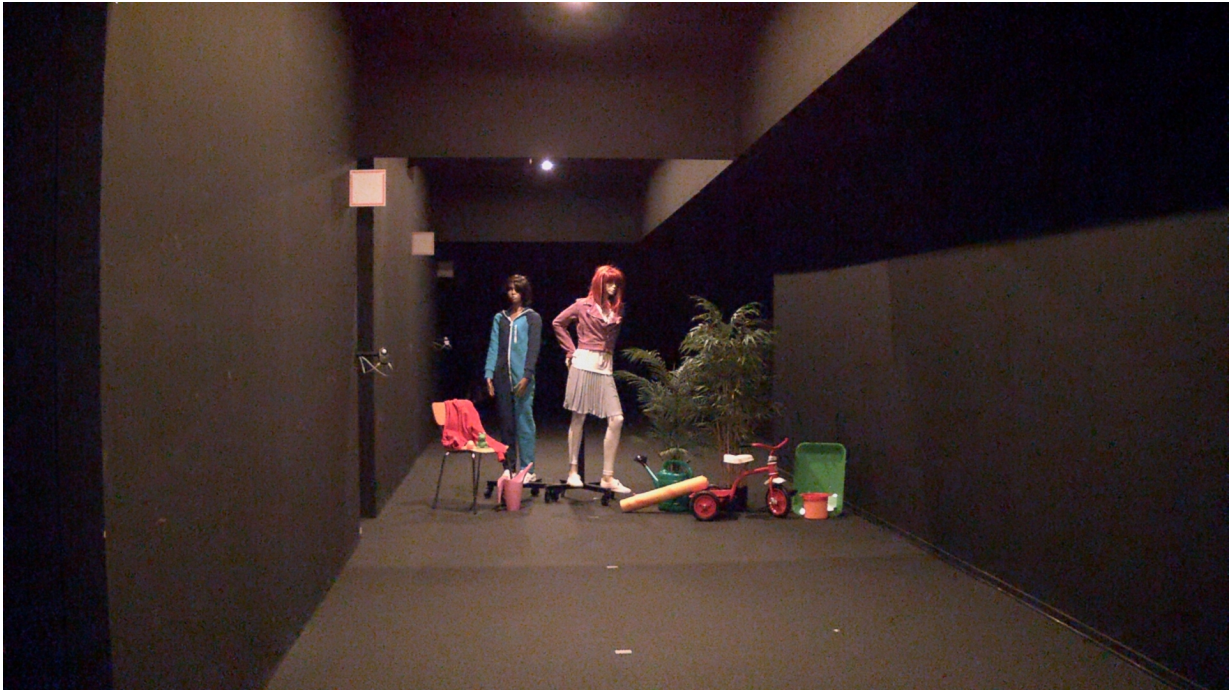
Figure 5. 0,2 lux-0,7 lux medidos en los objetos. La cámara con Lightfinder permite obtener unos colores intensos. Para el ojo humano, la visión en color apenas era posible y podían distinguirse sobre todo superficies con colores claros, aunque con poco detalle.

humano no fue capaz de percibir ningún color ni detalle y la imagen de la escena era de una oscuridad casi absoluta y solo los objetos más claros podían distinguirse mínimamente.