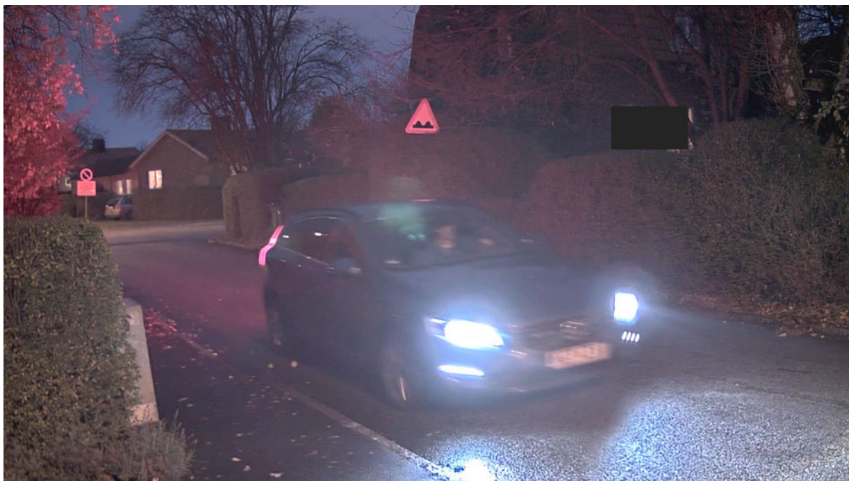
Figure 8. Un tiempo de exposición largo puede provocar una distorsión por movimiento visible. En esta instantánea, la matrícula podría haberse leído correctamente de haberse utilizado un tiempo de exposición más corto.

Las escenas con poca luz normalmente requieren unos tiempos de exposición más largos para que el sensor pueda capturar suficientes fotones para obtener una imagen utilizable. Si el tiempo de exposición es demasiado corto y la imagen demasiado oscura es posible aumentar el brillo digitalmente, pero el inconveniente es que entonces también aumenta el ruido. Sin embargo, con un tiempo de exposición largo cualquier objeto que se mueva deprisa puede quedar borroso en la imagen, ya que se desplaza por delante del sensor durante el intervalo de exposición. Este fenómeno, llamado distorsión por movimiento, es habitual en escenas con poca luz.