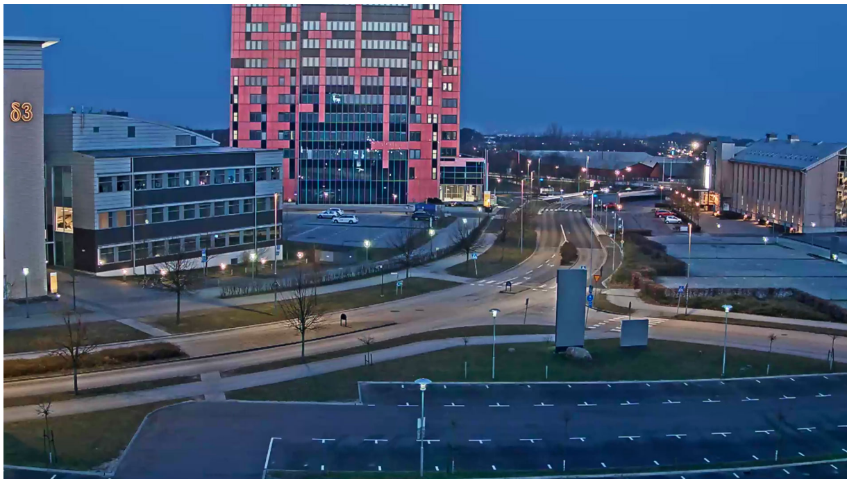
Figure 2. Instantánea de un vídeo nocturno en la que una cámara Lightfinder utiliza de forma óptima la luz existente.

de gran utilidad, por ejemplo en aplicaciones de analítica de vídeo, pero en la mayoría de situaciones resulta más atractivo el vídeo diurno, con sus colores y sus imágenes naturales.