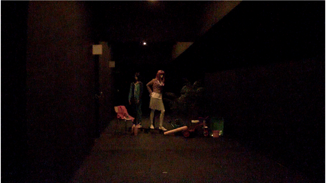
Figure 7. 0,02 lux-0,08 lux medidos en los objetos. La cámara Lightfinder obtiene una imagen oscura, con colores menos intensos pero distinguibles. El ojo humano solo podía distinguir vagamente las superficies más claras, sin poder percibir detalles ni colores de ningún tipo.