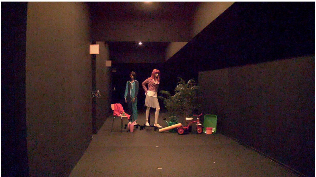
Figure 6. 0,1 lux-0,3 lux medidos en los objetos. La cámara con Lightfinder obtiene una imagen en color menos nítida, pero con un buen nivel de detalle. El ojo humano no podía distinguir las superficies más oscuras ni percibir detalles ni colores.