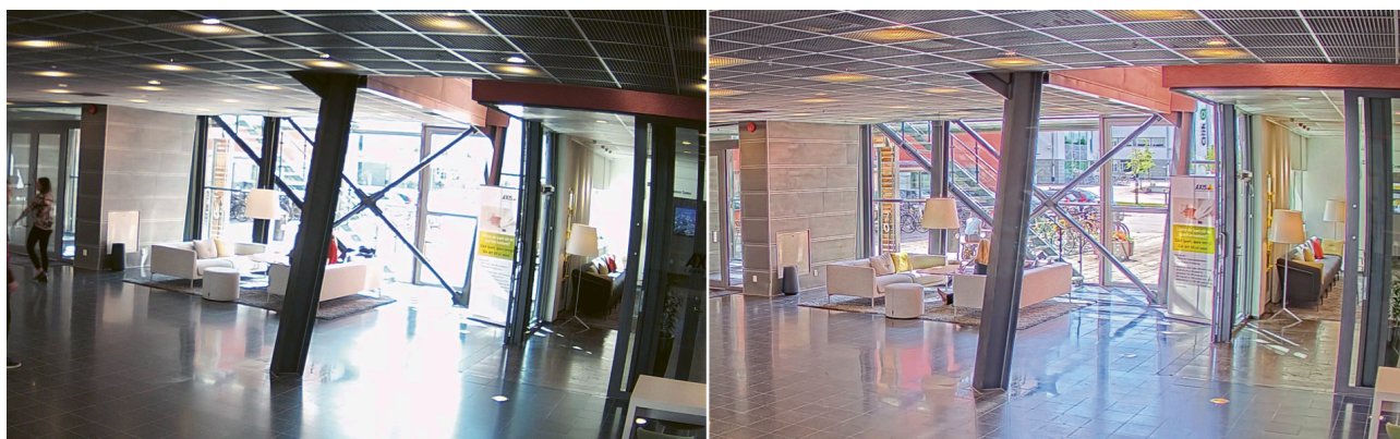
Figura 5.1 Scena interna con forte retroilluminazione. Confronto tra una telecamera senza funzionalità WDR (a sinistra) e una telecamera Axis con Forensic WDR (a destra).

La seguente figura confronta una scena acquisita con due telecamere diverse: una telecamera senza funzionalità WDR (a sinistra) e una telecamera Axis con Forensic WDR (a destra). Con Forensic WDR, i dettagli sono chiari e visibili sia nell'ambiente interno retroilluminato che all'esterno.