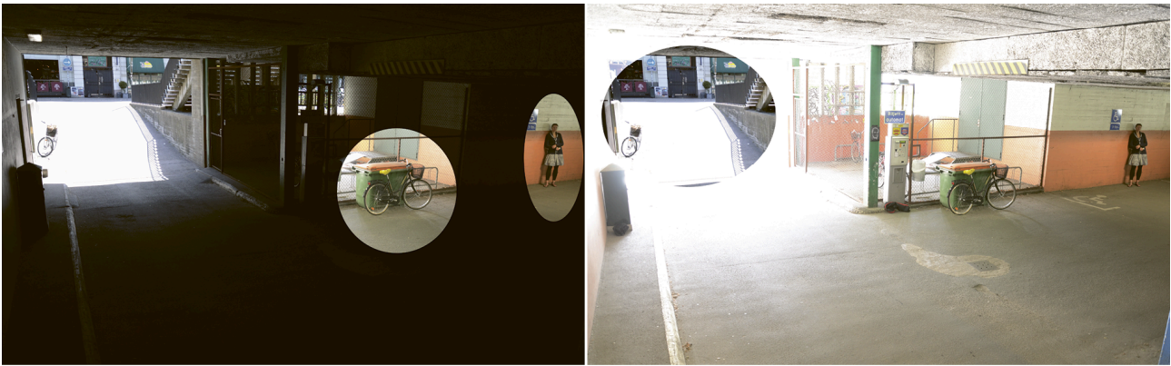
Figura 2.2 La stessa scena illustrata sopra. L'immagine a sinistra mostra i dettagli persi con un tempo di esposizione breve. L'immagine a destra mostra i dettagli persi con un tempo di esposizione lungo.

Per poter cogliere tutti i dettagli della scena, occorre una telecamera di sorveglianza dotata di WDR. In una sola immagine, la telecamera riesce ad acquisire entrambi gli estremi, ovvero mostra chiaramente i dettagli sia dell'ingresso illuminato che delle ombre scure all'interno del parcheggio. Senza la funzionalità WDR, la telecamera è in grado di produrre un'immagine utilizzabile solo nelle zone scure o luminose della scena, mentre le altre zone risulterebbero sottoesposte o sovraesposte.