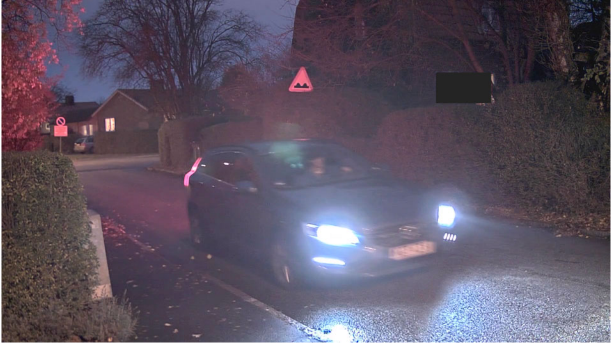
Figure 8. 노출 시간이 길면 모션 블러가 보일 수 있습니다. 이 스냅샷에서 더 짧은 노출 시간을 사용하면 번호판을 읽을 수도 있었습니다.

저조도 장면은 일반적으로 센서가 사용 가능한 이미지를 생성하기에 충분한 광자를 포착할 수 있도록 더 긴 노출 시간이 필요합니다. 노출 시간이 너무 짧아서 이미지가 너무 어두워진 경우, 디지털로 밝게 할 수는 있지만, 노이즈가 증가할 수 밖에 없습니다. 그러나 노출 시간이 길면 빠르게 움직이는 객체가 노출 간격 동안 센서를 가로질러 이동할 때 이미지에서 흐릿해질 수 있습니다. 이 현상은 모션 블러라고 하며 조명이 제한된 장면에서 흔히 발생하는 문제입니다.