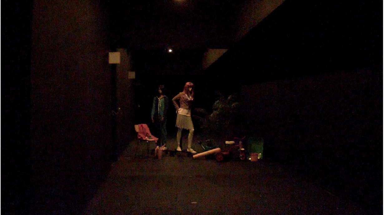
Figure 7. 객체 상의 조도 0.02 lux - 0.08 lux. Lightfinder 카메라는 약하지만 식별 가능한 색상의 어두운 이미지를 제공합니다. 인간의 눈은 가장 밝은 표면만 희미하게 구별할 수 있으며 디테일 또는 색상을 전혀 인식하지 못했습니다.