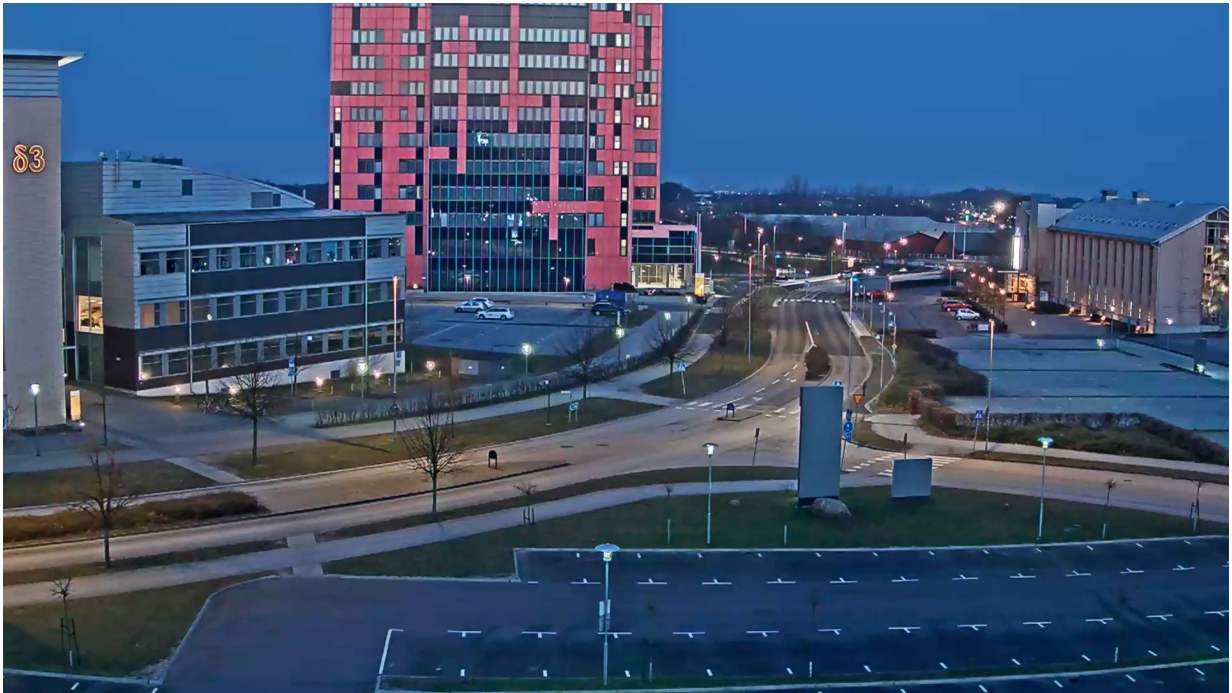
Figure 2. Lightfinder 카메라가 기존 조명을 최적으로 사용하는 야간 영상 스냅샷.

Lightfinder 카메라는 IR 조명으로도 보완될 수 있으며 대신 카메라의 야간 모드를 사용할 수 있습니다. 야간 모드의 흑백 IR 이미지는 비디오 분석 애플리케이션에서 대단히 유용할 수 있지만, 대부분의 경우 색상과 자연스러운 모습이 담긴 주간 모드 비디오가 더욱 유용합니다.