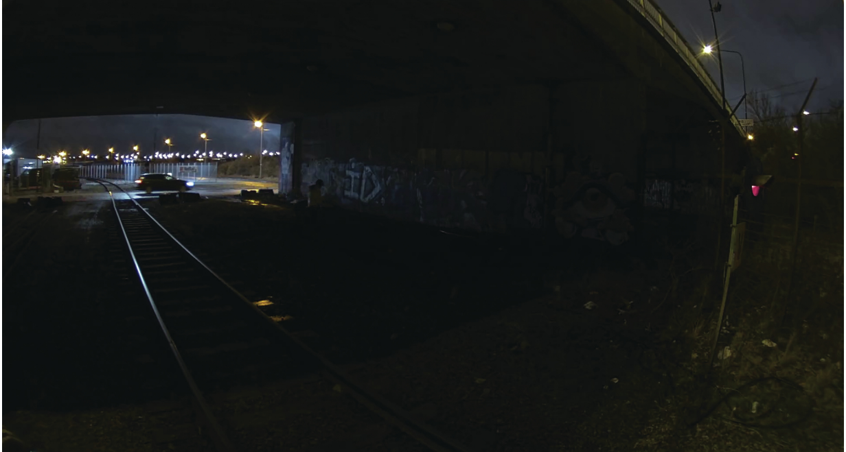
Figure 10. 이것은 현장에 있던 사람들이 볼 수 있었던 것입니다. 이 이미지는 인간의 눈으로 경험하는 어둠을 시각화하기 위해 조작되었습니다.

이와 비교하여, 다음 이미지는 동일한 장면을 인간의 눈으로 볼 수 있는 결과물로 시각화하기 위해 이 이미지를 조작한 스냅샷입니다. Lightfinder 2.0 카메라 옆에 있는 사람은 다리 아래 부분이 매우 어둡게 보이지만 일부 디테일은 여전히 구별할 수 있었습니다.