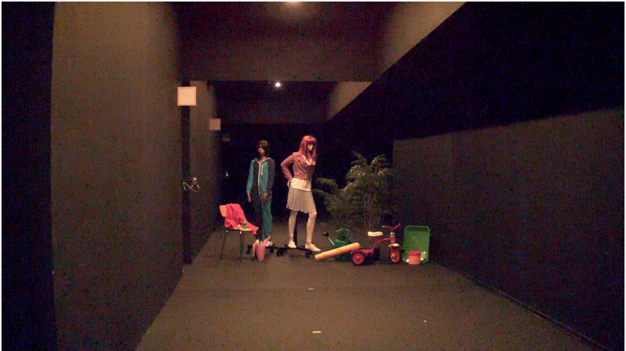
Figure 6. 객체 상의 조도 0.1 lux - 0.3 lux. Lightfinder 카메라는 덜 선명하기는 하지만, 여전히 디테일을 포함한 컬러 이미지를 제공합니다. 인간의 눈은 더 어두운 표면을 구별할 수 없으며 디테일 또는 색상을 인식하지 못했습니다.