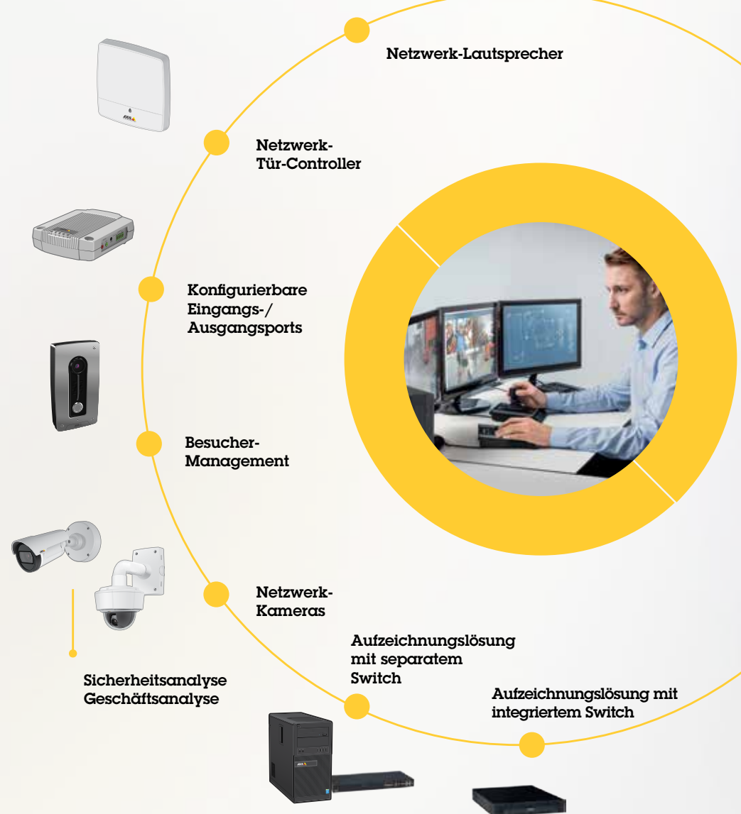
Aufzeichnungslösung mit integriertem Switch