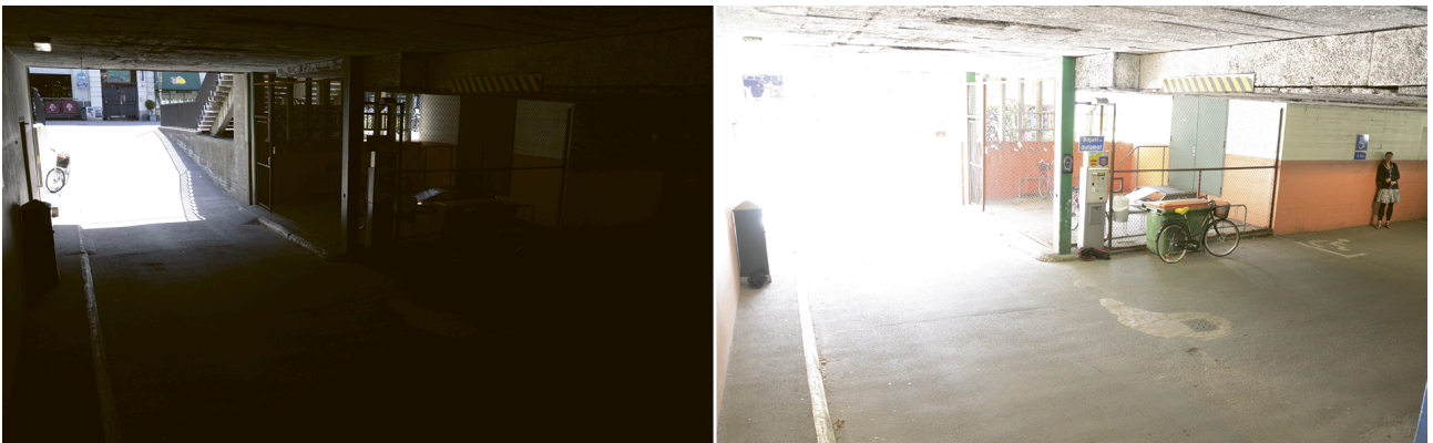
Figura 2.1 Escena de vigilancia típica con wide dynamic range: interior de un garaje y entrada. Las dos imágenes se han obtenido utilizando tiempos de exposición diferentes, uno más corto en la imagen de la izquierda y otro más largo en la imagen de la derecha.

A continuación, presentamos un ejemplo de una escena con un amplio rango dinámico, capturada con una cámara de vigilancia que no cuenta con la tecnología necesaria para procesar escenas WDR.