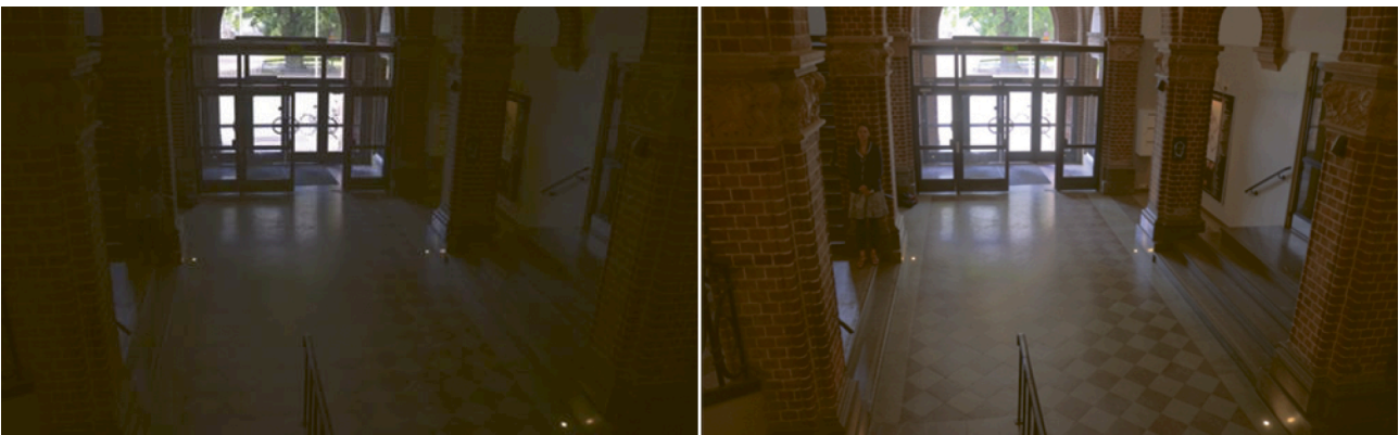
Ilustracja 6.1 Oświetlone od tyłu wnętrze zarejestrowane przez kamery o różnych wartościach dB. Wbrew temu, czego można by się spodziewać, obraz przedstawiony po prawej stronie został zarejestrowany przy użyciu kamery, której oficjalna wartość dB jest niższa niż w przypadku obrazu po lewej stronie.

Obraz przedstawiony poniżej po prawej stronie został zarejestrowany przy użyciu kamery, której oficjalna wartość dB jest niższa niż w przypadku obrazu po lewej stronie. Wbrew temu, czego można by się spodziewać, w tej scenie o szerokim zakresie dynamiki kamera o niższej wartości dB niewątpliwie wygenerowała obraz lepiej przystosowany do dozoru wizyjnego. Jak można się domyślić, kamera o niższej wartości dB miała też inne funkcje, takie jak lepsze przetwarzanie obrazu, które polepszały jej parametry WDR.