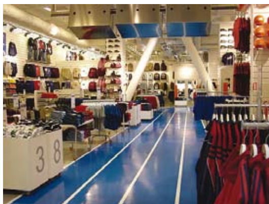
Данные счетчика посетителей являются неоценимой помощью при планировании структуры торговых площадей.