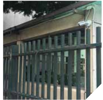
学校の外堀とキャンパス内には、IR LED搭載の屋外対応バレットタイプのアクシスカメラ「AXIS P14シリーズ」が設置され、どんな天候下でも24時間鮮明で安定した高画質画像を提供しています。

日新小学校にとって次のステップは、脅威をいち早く検知して防御することです。学校では、アクシスの革新的なAXIS Perimeter Defenderをテストしてみました。これは、カメラのフロントエンドでインテリジェントなビデオ分析を実行し、誤報を最小限に抑える、柔軟で正確なアドオン・アプリケーションです。日新小学校は、このトライアルの結果に非常に満足しました。次の段階では、映像監視システムがキャンパス全体に、順を追って設計エリアごとに導入されていきます。日新小学校は、アクシス周辺保護ソリューションの全面的な採用によってさらに分析と警報の効率を向上させ、生徒にとってより安全な教育環境を確保することを目指しています。