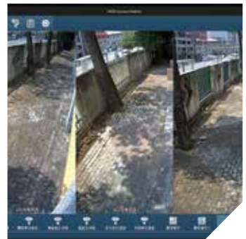
ビデオ管理プラットフォームAXIS Camera Stationのユーザーインターフェースは、シンプルで直観的です。スクリーンにはアスペクト比9:16の縦型画像が表示され、学校の外堀に沿った監視範囲を拡大しながら、必要なカメラの数は少なくします。