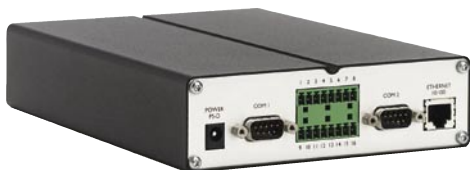
*付属のI/Oターミナルブロックコネクタを外した状態