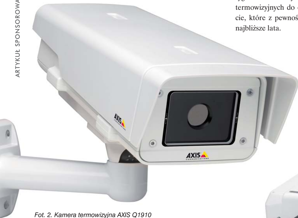
Fot. 2. Kamera termowizyjna AXIS Q1910

w tym także między innymi sprzęt produkowany przez firmę Axis Communications. Rozwiązania IP znajdują też szczególne zastosowanie w systemach monitoringu miejskiego. Wykorzystanie kamer o dużej rozdzielczości i szerokim kącie obserwacji pozwala na instalację znacznie mniejszej ich liczby niż w przypadku urządzeń o mniejszej rozdzielczości. Funkcje inteligentnej analizy obrazu umożliwiają znacznie mniejsze zaangażowanie personelu odpowiedzialnego za monitoring oraz wydajne przyspieszenie reakcji służb w razie wystąpienia sytuacji niestandardowych. Dodatkowo, dzięki funkcji PoE ( Power over Ethernet ) instalacja systemów IP nie wymaga dodatkowego okablowania służącego do zasilania urządzeń.