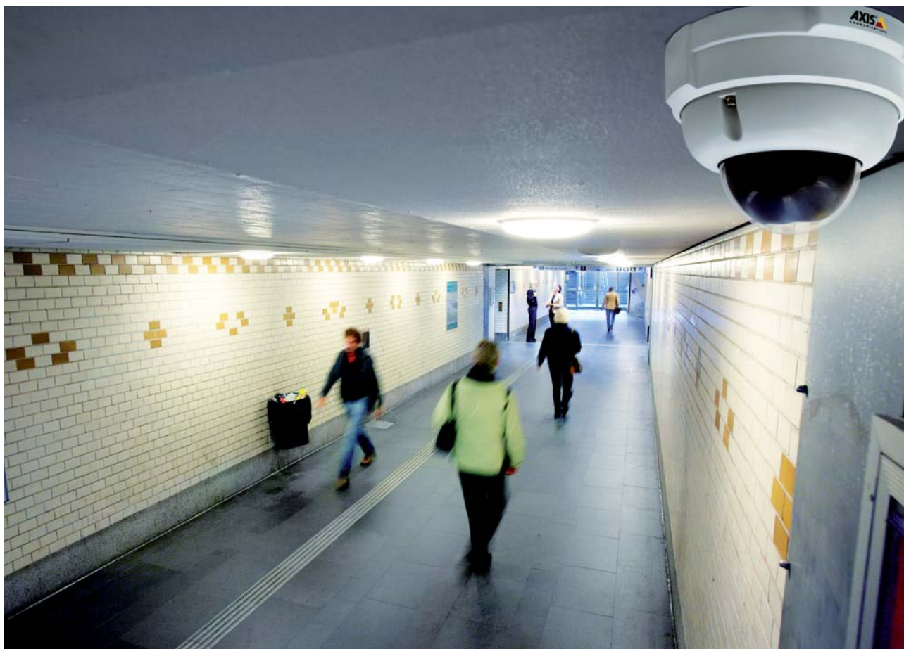
Fot. 1. Nowoczesne kamery sieciowe sprawdzają się w każdych warunkach

Dzięki zastosowaniu najnowszych technologii, gwarantujących uzyskanie ostrego, klarownego obrazu, materiał wizyjny zarejestrowany przez kamery cyfrowe może służyć jako nieoceniony dowód w postępowaniach sądowych. Odróżnia to kamery cyfrowe od modeli analogowych, które nawet przy najwyższej z możliwych w ich przypadku rozdzielczości (4CIF) nie były w stanie dostarczać wiarygodnego obrazu scen o dużym natężeniu ruchu. Wynika to z charakteru obrazu analogowego, który powstaje w wyniku skanowania z przeplotem, tzn. obrazy tworzone są z dwóch pól linii parzystych i nieparzystych – ich nałożenie tworzy pełną klatkę. Ta cecha obrazu analogowego