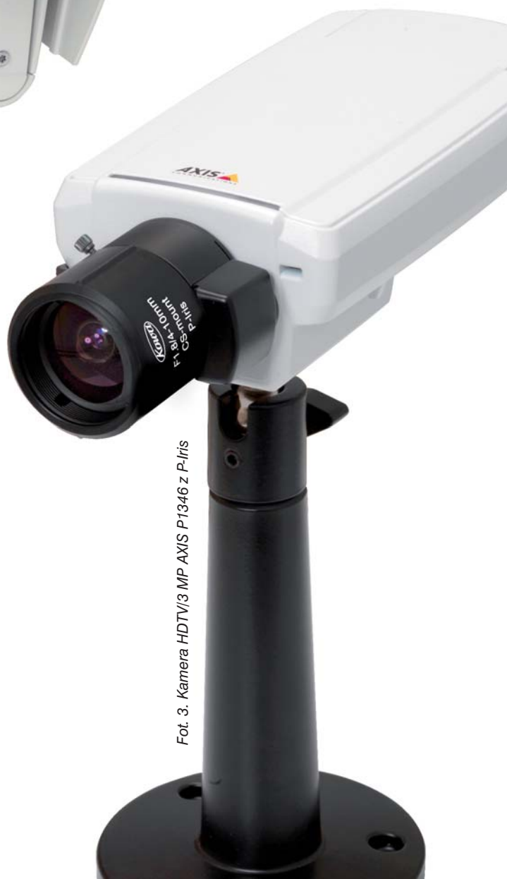
Fot. 3. Kamera HDTV/3 MP AXIS P1346 z P-Iris

Rzecz systemów nadzoru wizyjnego zmierza w kierunku opracowywania urządzeń do coraz bardziej rozbudowanych instalacji zewnętrznych, stwarzających coraz wyższe wymagania użytkowe. Na rynku pojawiły się już systemy wykorzystujące kamery termowizyjne, które umożliwiają niezawodne wykrywanie ludzi i zdarzeń nawet w całkowitych ciemnościach lub w trudnych warunkach pogodowych, np. podczas silnej mgły czy zadymienia. Kamery te tworzą obraz w reakcji na ciepło