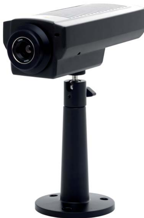
Fot.2. Kamera termowizyjna AXIS Q1910