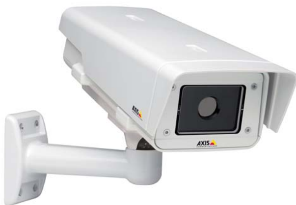
Fot.1. Kamera termowizyjna AXIS Q1910-E

W pewnych sytuacjach użycie silnego źródła światła na potrzeby konwencjonalnego monitoringu może być niewskazane ze względu na zagrożenia wynikające z potencjalnego oślepienia osób przebywających w danym miejscu. Z tego powodu kamery termowizyjne są preferowanym rozwiązaniem w miejscach, w których poruszają się pojazdy, np. w tunelach kolejowych lub na pasach lotniczych. Na obrazach wytwarzanych przez kamery termowizyjne nie ma cieni, dlatego stanowią one niezawodne źródło danych wizyjnych i umożliwiają ograniczenie liczby fałszywych alarmów oraz efektywną analizę zarejestrowanego materiału. Wykorzystanie promieniowania termicznego w trakcie monitoringu pozwala także na skuteczne wykrywanie obecności ludzi w budynkach po godzinach pracy lub w sytuacjach wyjątkowych. Kamery termowizyjne umożliwiają szybkie wykrywanie pożarów, weryfikację źródeł fałszywych alarmów i błyskawiczne podejmowanie kroków zaradczych, dlatego systemy termowizyjne świetnie sprawdzają się w takich miejscach, jak tunele i perony kolejowe, mosty, niebezpieczne skrzyżowania, a także magazyny logistyczne.